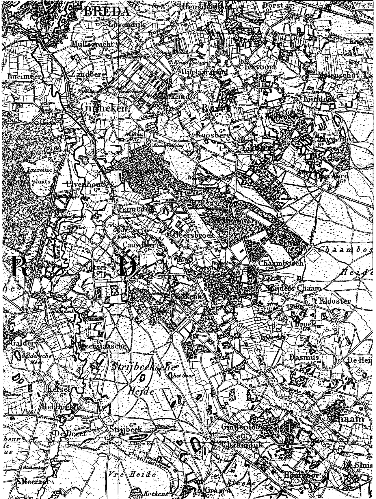
Nieuw-Ginneken, ca. 1850. Schaal 1:50.000.